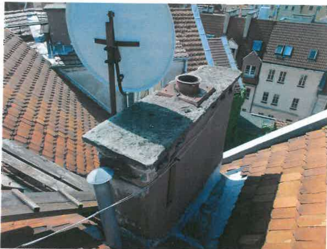
Fot. 3. Tynki kominowe odspojone, czapy betonowe lokalnie spękałe i na krawędziach odspojone