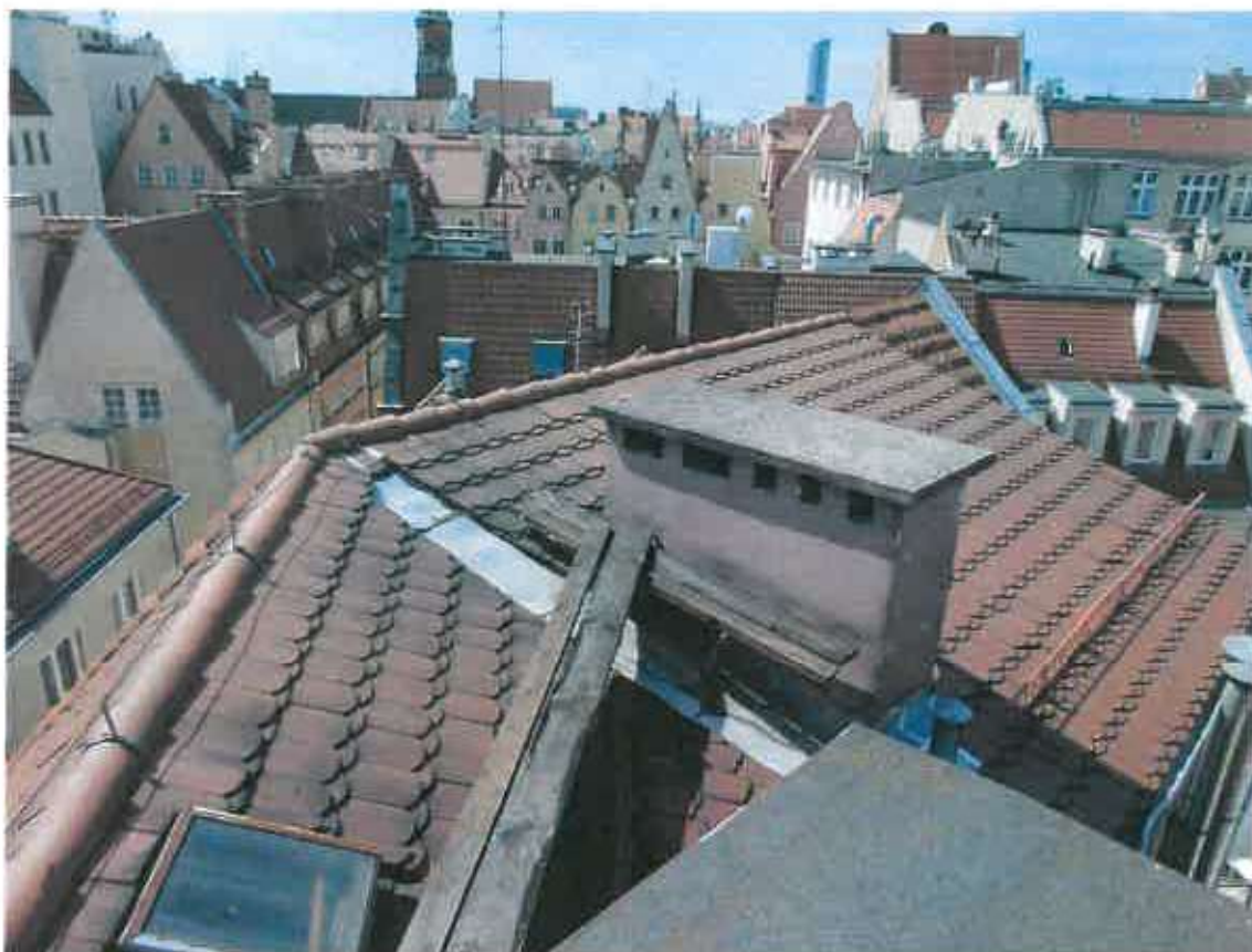
Fot. 5. Drewniane ławy kominiarskie zmurzone