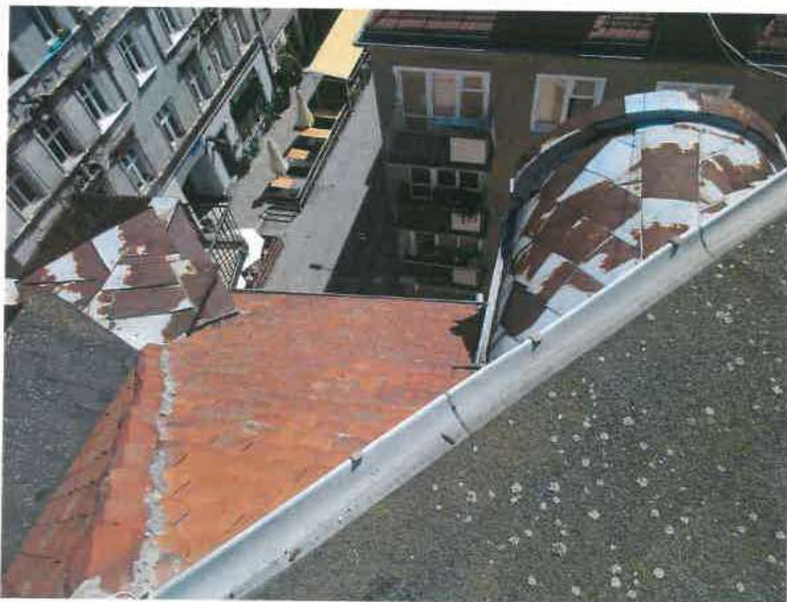
Fot. 4. Pokrycie lukarn skorodowane