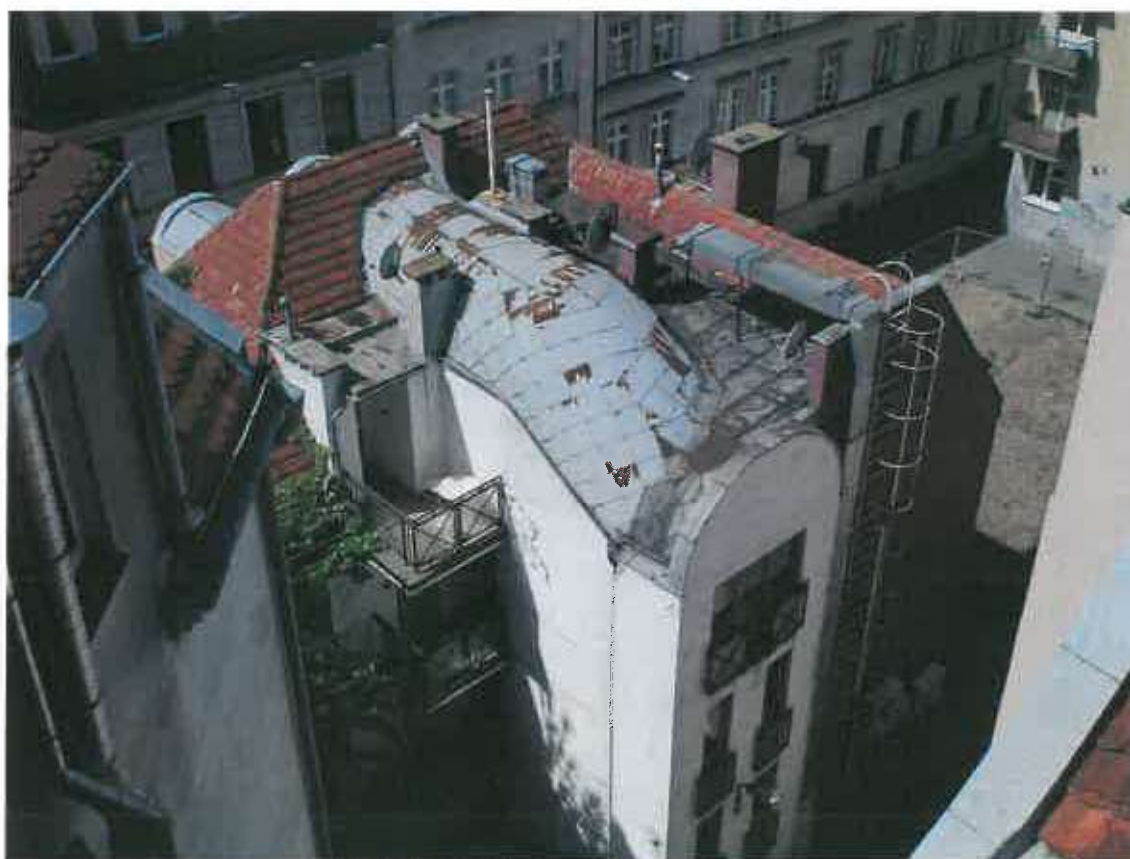
Fot. 6. Pokrycie z blachy ocynkowanej skorodowanej